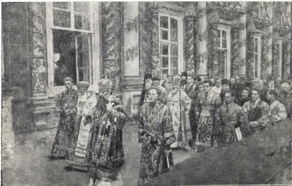
ТОРЖЕСТВЕННОЕ ШЕСТВИЕ НА СЛУЖЕНИЕ В УСПЕНСКИЙ СОБОР В ТРОИЦЕ-СЕРГИЕВОЙ ЛАВРЕ

Уже окончилась ранняя литургия в Трапезном и Святодуховском храмах, и верующие заполнили Успенский собор в ожидании поздней литургии, которую должны были совершать приехавшие в Лавру Главы четырех Православных Церквей — Русской, Грузинской, Румынской и Болгарской, в сослужении сонма духовенства. Плотные массы паломников выстроились вдоль пути шествия святителей и духовенства из Патриарших покоев в Успенский собор. В светлых облачениях они последовали в собор.